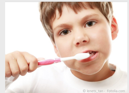
Bei der Prophylaxe lernen Ihre Kinder die richtige Zahnpflege.

Es gibt also keinen Grund, warum Sie auf Prophylaxe für Ihre Kinder verzichten sollten.