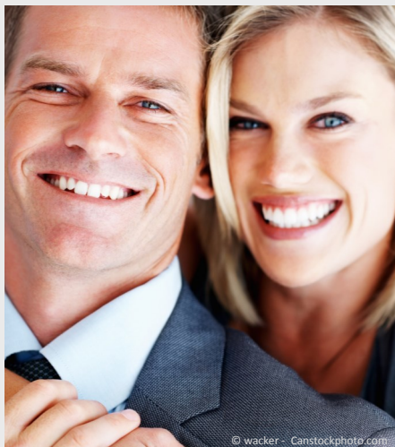
Selbstsicher mit gepflegten Zähnen

Dann werden Mund, Zähne und Zahnfleisch untersucht. Die Zahnbeläge werden angefärbt, um sie besser sichtbar zu machen und es wird die Tiefe der Zahnfleischtaschen gemessen.